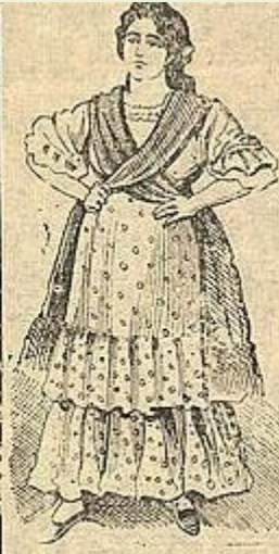
Gastaba muchos monecos, cuando bailaba boleros.

La Cucaracha en euastión cargaba muy buena plata, ahora con tanto cartón sada bailando en la reata.