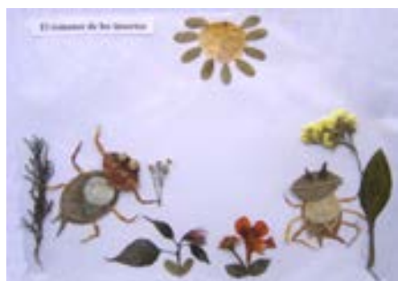
El romance de los insectos

Es, si podemos hacer la comparación, como utilizar hojitas, pétalos y ramitas pequeñas para convertirlas, ya secas y en estado “de ser desechadas por inútiles o muertas”. Pero sí es posible reciclarlas convirtiéndolas en obras de arte... y así puede ser en el amor.