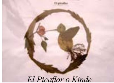
El Picaflor o Kinde

Tal como ocurre para concretar estas pequeñas obras de arte, recurriendo a lo mejor que poseemos, algo similar exige el amor para conseguir que se concrete en la felicidad, que no es permanente sino fugaz, enraizando en el alma para vencer aquellas inevitables etapas difíciles que se tiene que atravesar a lo largo de la vida.