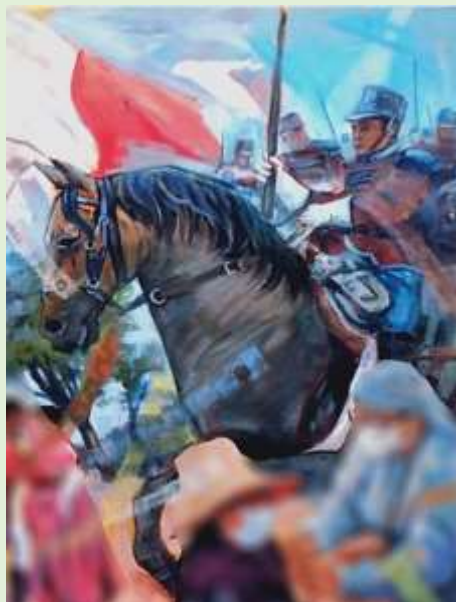
(El regimiento "Los lanceros de la victoria" creada en la ciudad de Cajabamba)