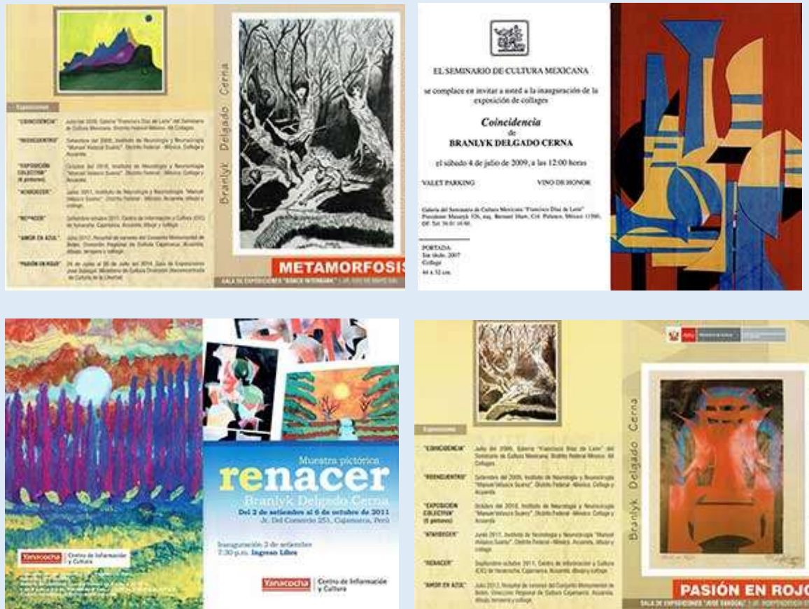
Carátulas de catálogos de sus principales exposiciones

2009. Reencuentro , Instituto de Neurología y Neurocirugía “Manuel Velasco Suárez”. Ciudad de México, Distrito Federal. Collage y acuarela.