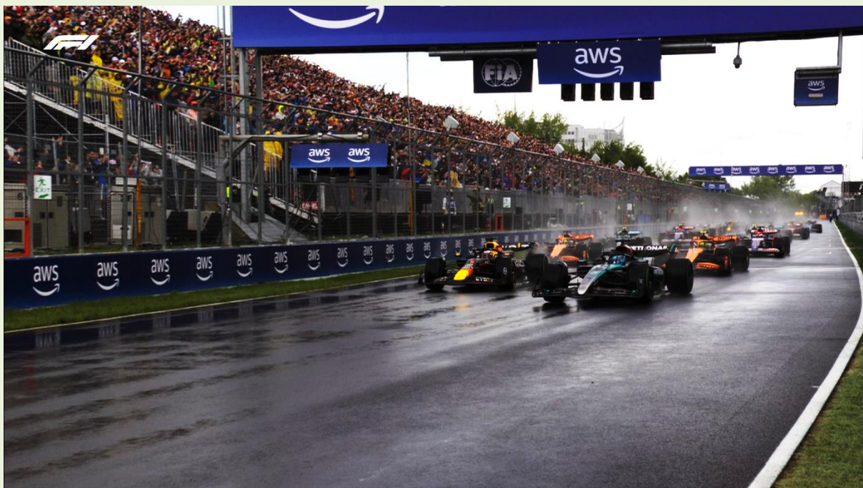
Resultados del GP de Canadá (9 de junio 2024)